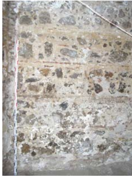
Figura 7. Paramento de mampostería entre dobles verdugadas de ladrillo característico de los siglos XIV-XV.