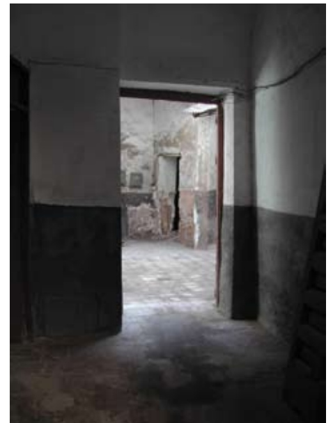
Figura 6. Acceso al inmueble en codo para preservar la intimidad interior