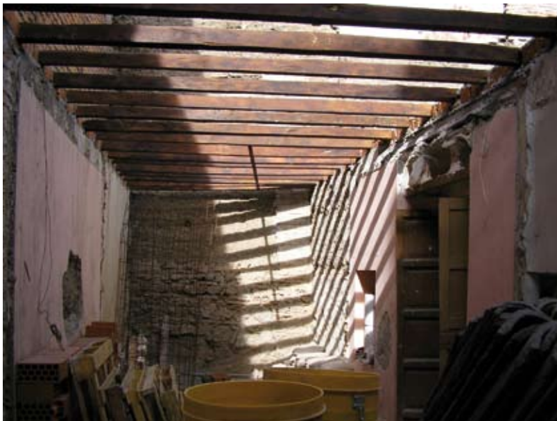
Figura 8. Crujía Oeste del Patio 1. Se corresponde este espacio con uno de los palacios descritos en el siglo XV