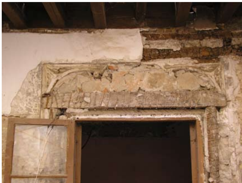
Figura 3. Yesería de tipo Gótico en la entrada al Palacio que actualmente se corresponde con la Crujía Oeste del Patio 1.