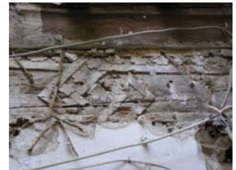
Figura 9. Distintas carpinterías del inmueble. A la derecha las correspondientes a la planta baja o principal de la Crujía Este, cuya cronología podríamos situar en el siglo XII aproximadamente. Arriba, canes aquillados del forjado de planta primera de la Crujía Este, de cronología posterior (Siglos XIV-XV).