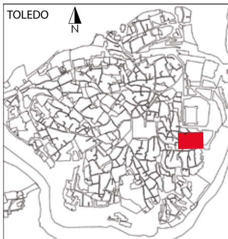
Figura 2 : Situación

La vivienda de la Calle San Miguel nº 13 muestra la pervivencia de la estructura principal de un espacio doméstico cuya cronología inicial podríamos encuadrar aproximadamente en el siglo XII, en base a algunos paramentos y carpinterías. Esta