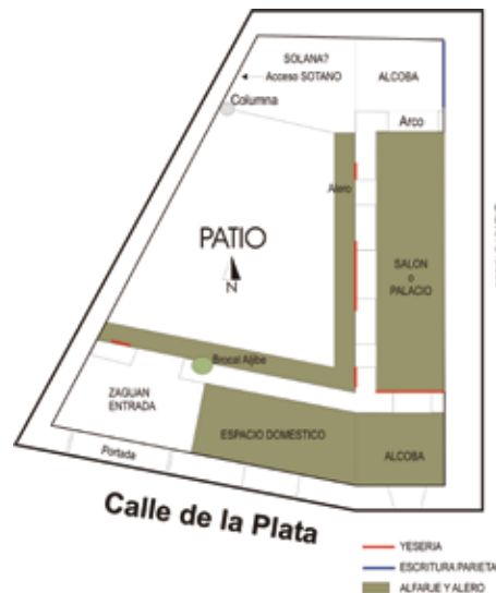
PLANTA CROQUIS VIVIENDA SIGLO XV

torreón, situado en la esquina sureste del inmueble, se conserva una cubierta de par y nudillo que presenta decoración policroma de tipo Plateresco, también original del inmueble.