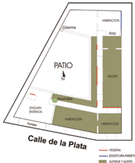
PLANTA CROQUIS ESTADO ACTUAL